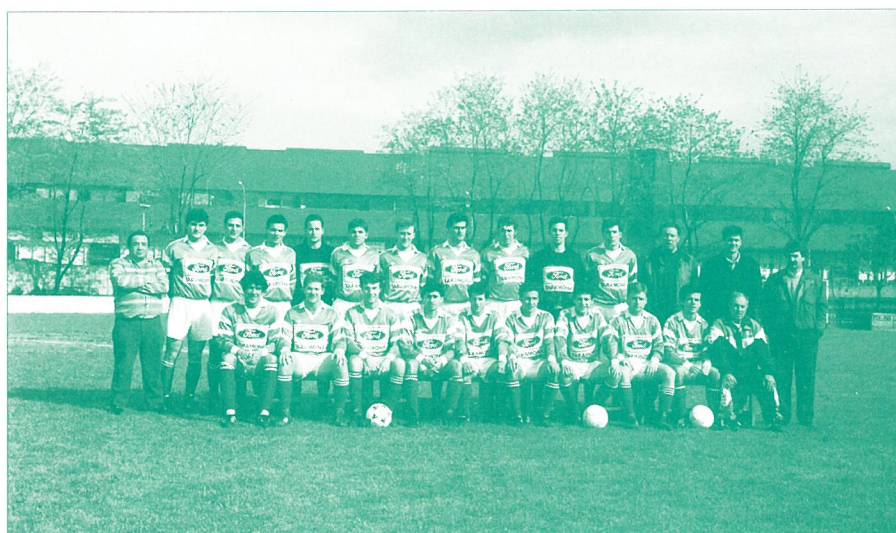
Zorrotza Futbol Taldea. 94 - 95 ihardunaldia.