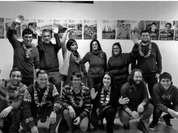
Zorrotz Morrotzeko erredakzio taldea