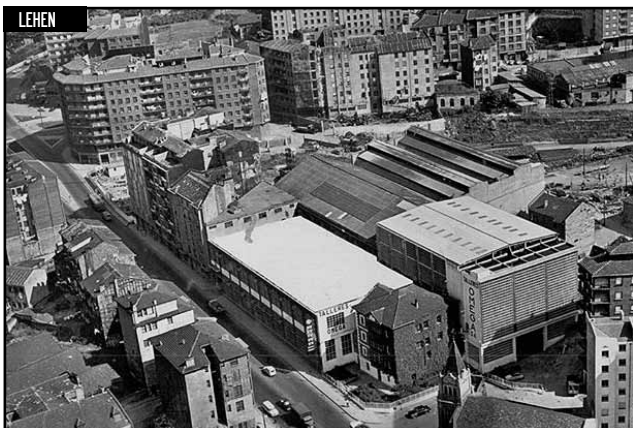
Talleres Omega. 1963. urtea