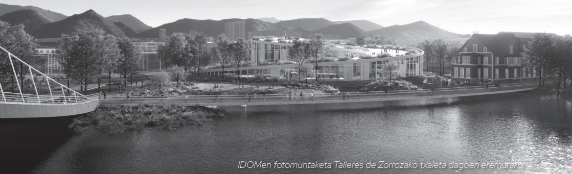
IDOMen fotomuntaketa Talleres de Zorrozako txaleta dagoen eremurako

espazioak sortuz. Lau zubi ere planteatzen dira, hiru zirkulazio mistokoak (Elorrieta, Zorrotzaurre eta Burtzeñarekin) eta bat oinezkoentzat (Burtzeñarekin). Era berean, 58.126 metro koadro erreserbatuko dira berdeguneetarako Ibaizabal itsasadarraren eta Kadaguaren ertzeko eremu publikoa aprobetxatuz.